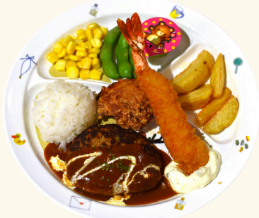
わんぱくプレート (黒毛和牛ハンバーグ・エビフライ・唐揚げ)