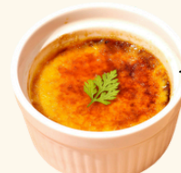
濃厚クレームブリュレ