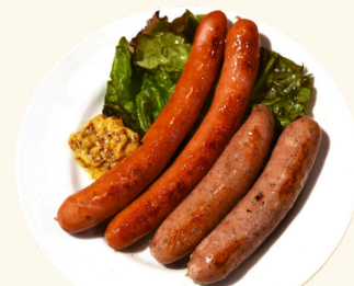
ソーセージ盛り合わせ