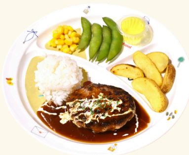
キッズハンバーグ