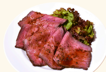
自家製ローストビーフ