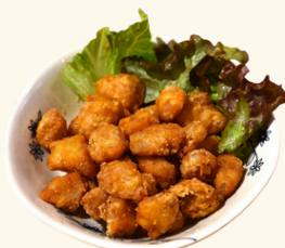
なんこつの唐揚げ