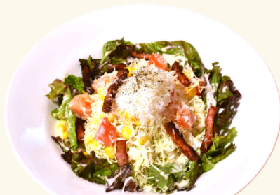
こんがりベーコンと チーズのシーザーサラダ